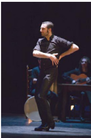
01-07 Nieuwe Muziekgebouw a 't IJ A' dam

INFORMATIE: St. TERREMOTO (Kunst en Flamenco) Amstelkade 60 III, 1078 AK Amsterdam T: (020) 67 64 227 (do: 12.00 -14.00u) F: (020) 67 64 271 info@terremoto.nl www.terremoto.nl